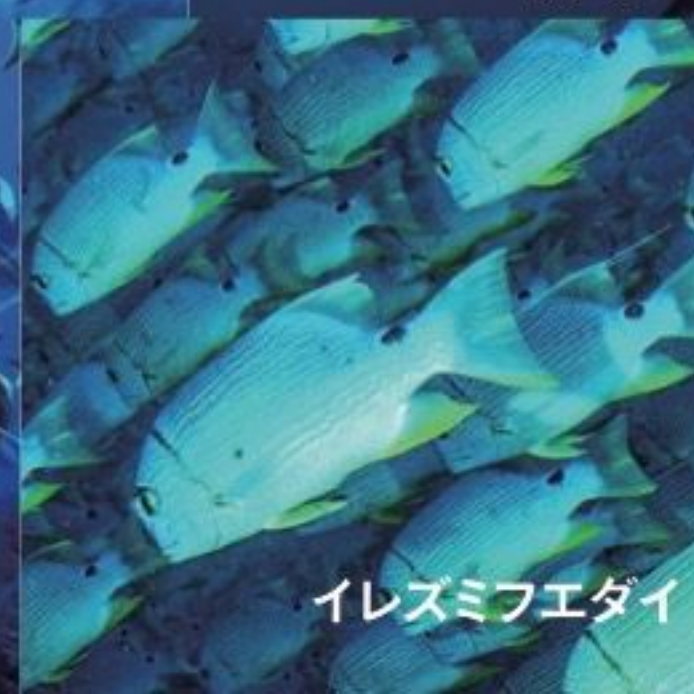
イレズミフエダイ