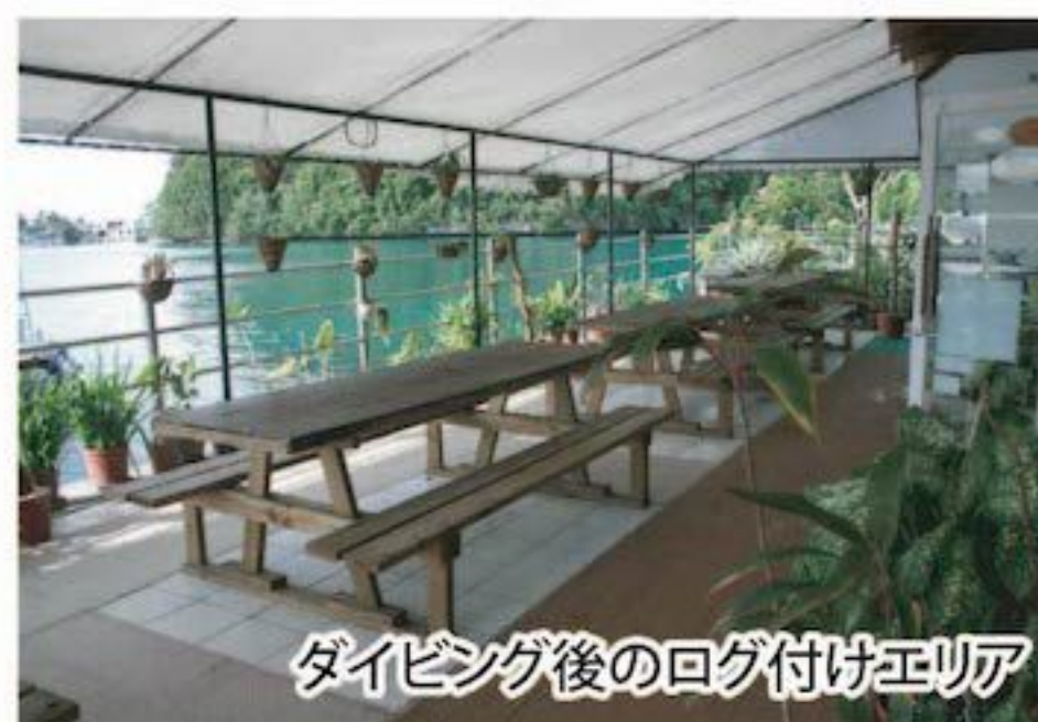
ダイビング後のログ付けエリア

ホテル併設のメリットを活かした明るい広々とした敷地に、プロショップ、機材保管室、温水シャワーエリア、機材洗い場、ログ付けのためのテラスなどがダイバーに使いやすいよう機能的に配置されています。