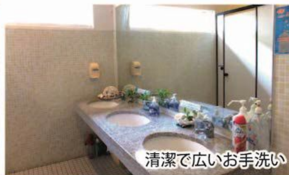
清潔で広いお手洗い