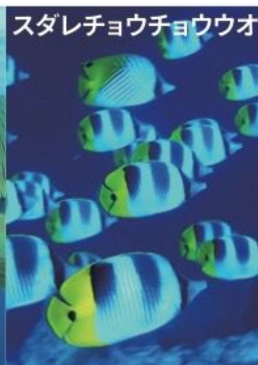
スタレチョウチョウウオ