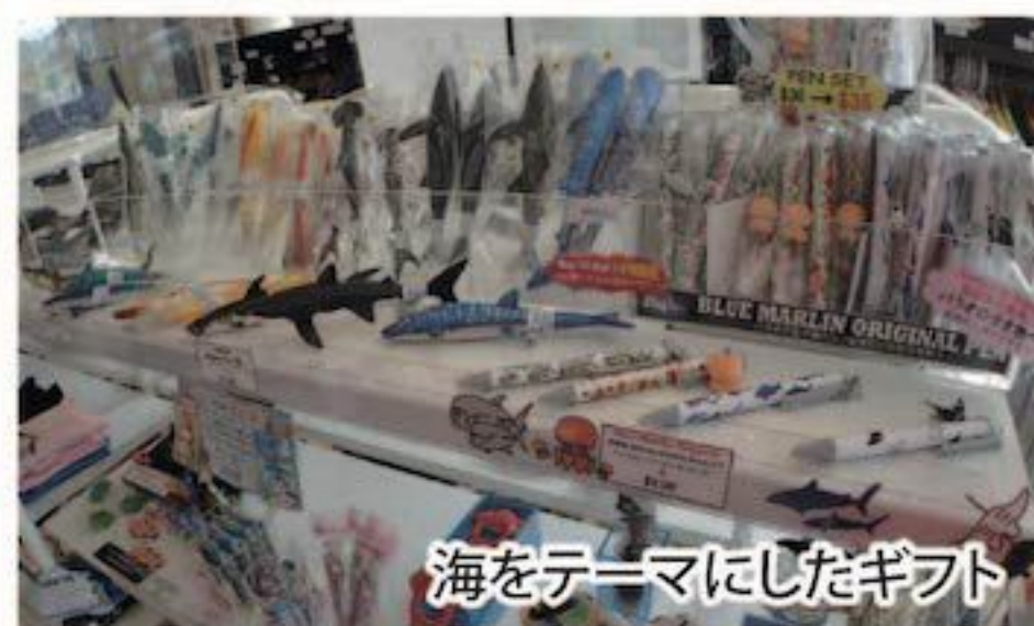
海をテーマにしたギフト