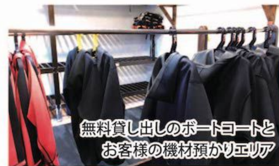
無料貸し出しのボートとお客様の機材預かりエリア