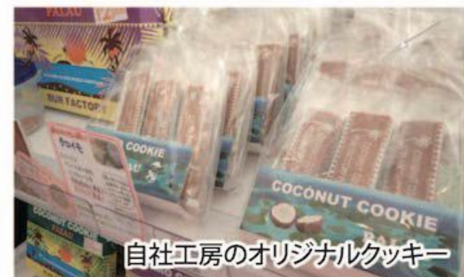
自社工場のオリジナルクッキー