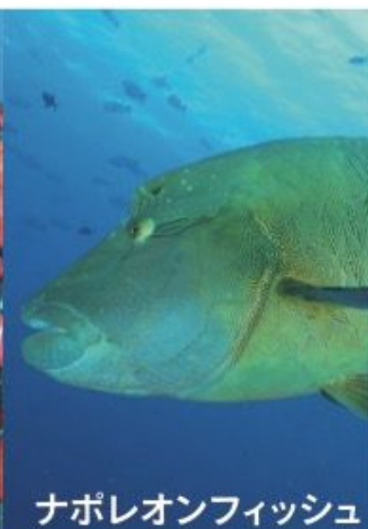
ナポレオンフィッシュ