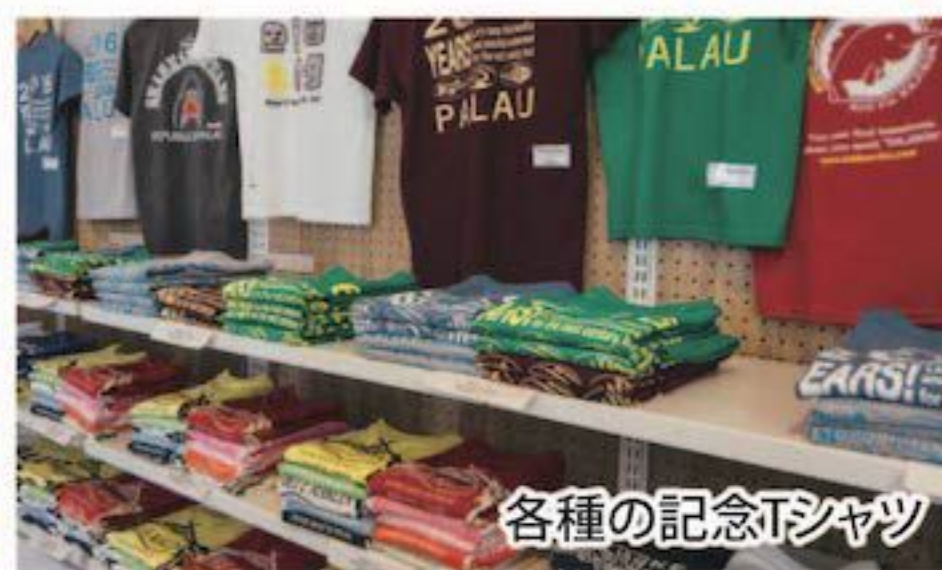
各種の記念Tシャツ