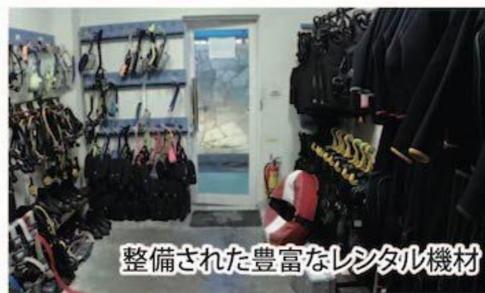
整備された豊富なレンタル機材