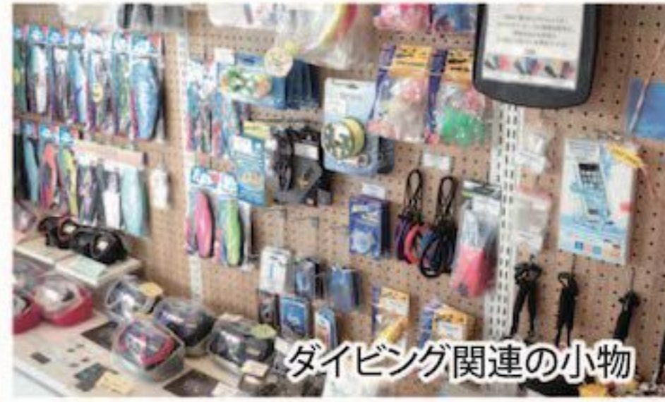
ダイビング関連の小物