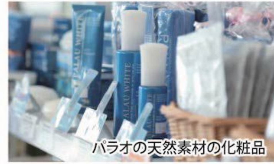
パラオの天然素材の化粧品