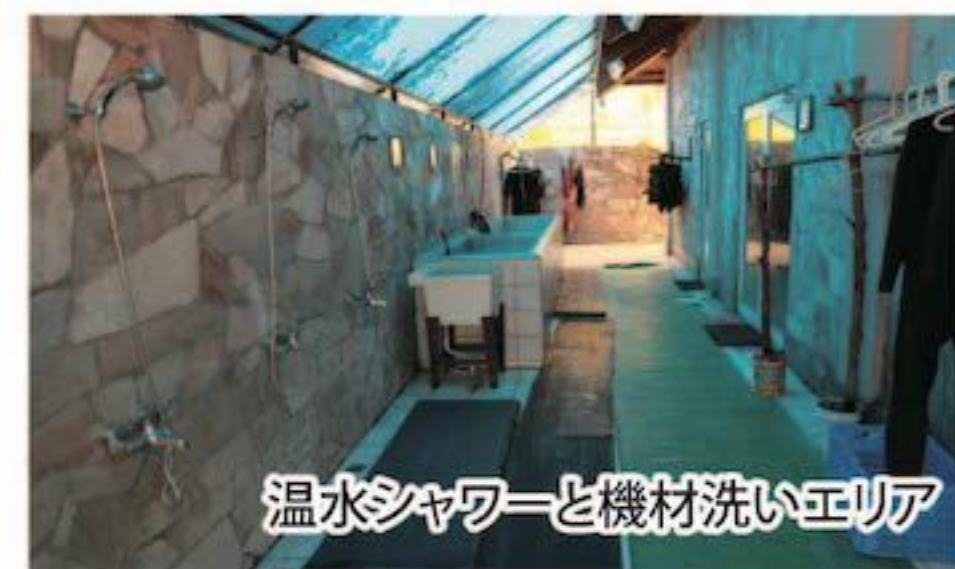
温水シャワーと機材洗いエリア