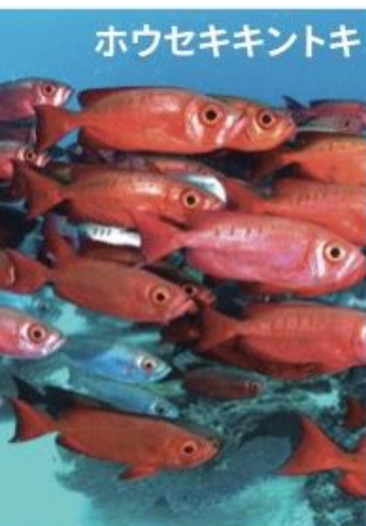
ハウセキキントキ